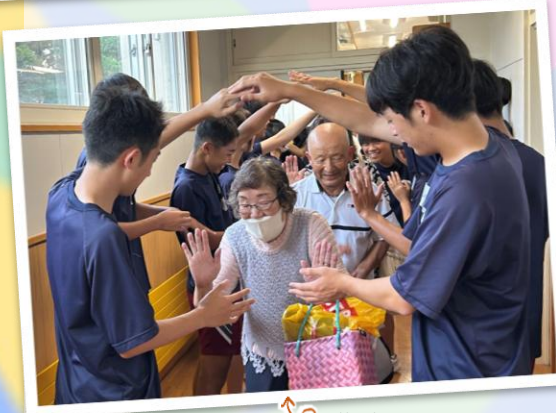
花道を作ってお見送り♪

地域を支える世代と、未来を担う中学生が直接触れ合う機会は、互いの理解を深める大切な一歩となったのではないのでしょうか。