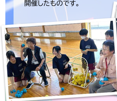
スポーツレク：玉入れ それ！はいれ！