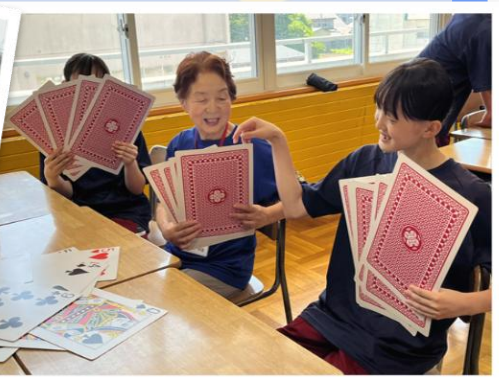
テーブルゲーム：巨大トランプで対決だ!!