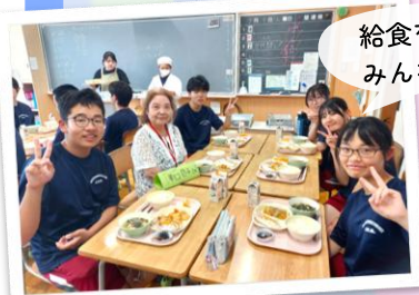
給食を囲んで みんなでピース!!

3年生は、この日のために、県立大学の本間先生を講師に迎え、事前学習として「コミュニケーション」のあり方を中心に学んできました。また、企画・進行を担当し、ふれあいサロンの皆さんに対して、それぞれが工夫を凝らした“おもてなし”を実践しました。