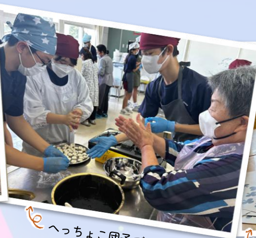
へっちょこ団子づくり