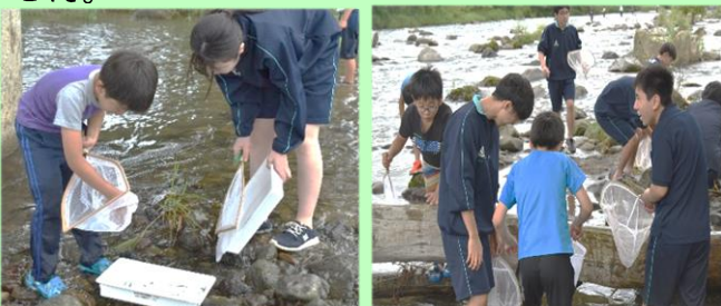
『優しく小学生に声掛けをする高校生たち』

地域のために、自分たちができる活動を考え栗石町を盛り上げようとする栗石高等学校の生徒さんの活躍から今後も目が離せません。