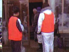
声かけを行い元気でいらっしゃるか確認します。