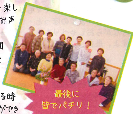
最後に 皆でパチリ！

⑩ボランティア団体意見交換会をきっかけに素敵な出会いが生まれ、心温まる時間を過ごすことができました。