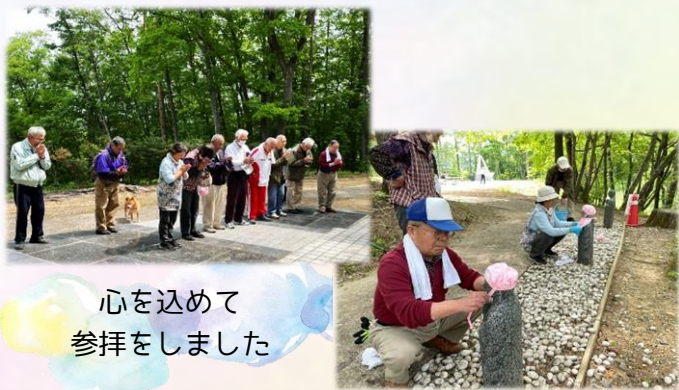
心を込めて参拝をしました

戸沢いきいきサロンの方々は、「7月30日は追悼の日なので、町民の皆さんも是非参拝へお越しください。」と話されていました。