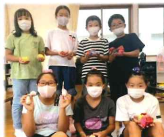
お手玉に喜ぶ子どもたち