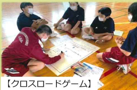
【クロスロードゲーム】