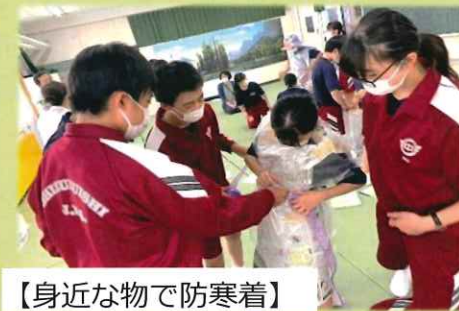
【身近な物で防寒着】