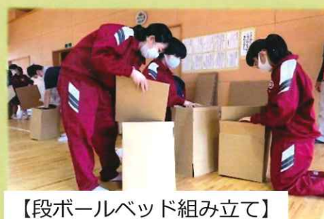
【段ボールベッド組み立て】