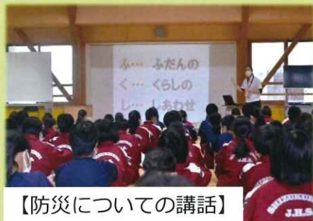
【防災についての講話】

9月9日(木)に粟石中学校1学年120名を対象に、防災教育出前講座を実施しました。いつ自分たちの身に起きるか分からない災害に対して、一人一人が日頃から自分たちで出来ること、日頃から備えておくべきことを考え、自分たちの力で災害を乗り越え、誰かを助けられる生徒になれるように、防災に対する意識を高めました。